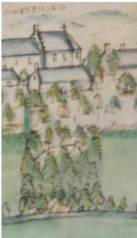
Van den Berge, Deel van de kaart van de Bovenpolder 1597 xxvii

De voorburcht op de kaart 1597 kan qua ligging niet anders dan het voorhuis van De Roos zijn, maar daar ontbreekt het achterhuis op de tekening.