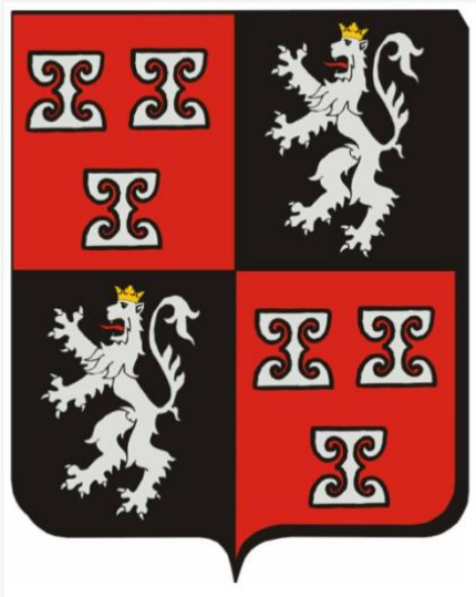
Wapen van Lievendaal vii

Overigens kende Amerongen nog meer leenheren. De Domproost beheerde de lenen namens het bisdom Utrecht die veel grond in Amerongen had, met name bosgrond.