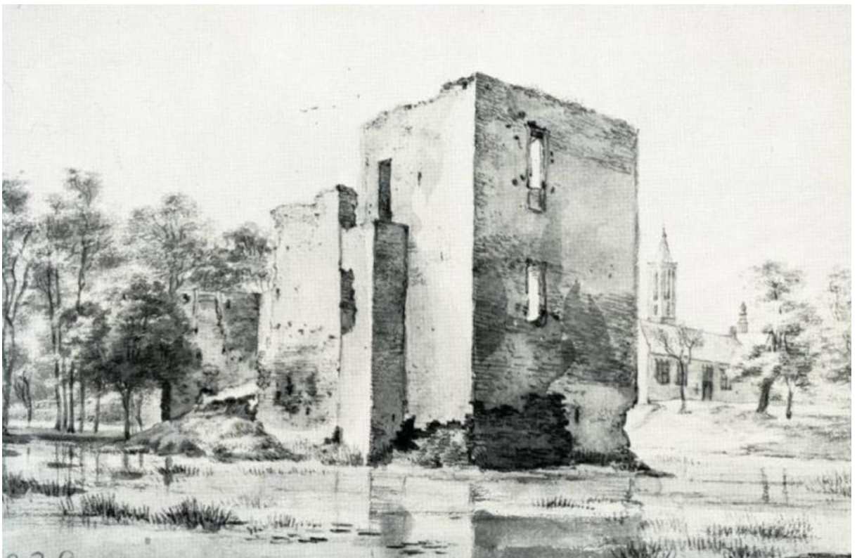
Lievendaal getekend vanuit het zuid-oosten (Roelant Roghman, 1646/1647, Collectie Teylers Museum, Haarlem)

Lievendaal bestond uit twee bouwlichamen, die ten opzichte van elkaar versprongen, omringd door een gracht en een omwalling. Het hoofdbestanddeel wordt gevormd door een zware vierkante woontoren (hierboven links, daaronder rechts) met een aanbouw (hierboven rechts) waarvan de muur even hoog lijkt als de toren.