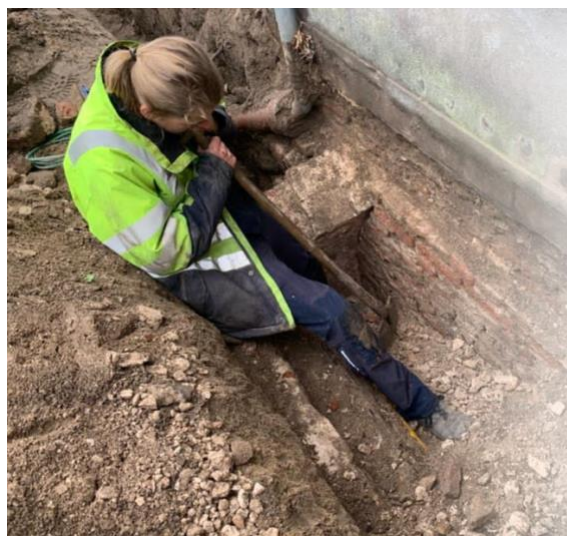
Afgekapt gewelf (dichtgemetseld met 18 e eeuwse stenen) buiten de huidige voorgevel aan de Nederstraat. Links de middeleeuwse fundering van de oorspronkelijke voorgevel. Opgraving 2021

De voorburcht op de kaart uit 1597 is ongetwijfeld een voorganger van het huidige voorhuis van De Roos wat een herbouw uit ca 1700 is. De herbouw uit ca 1700 is ook op oudere fundamenten met gewelvenkelders die bovendien een meter verder de Nederstraat op stonden.