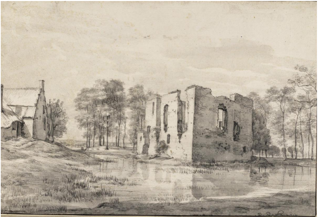
Lievendaal getekend vanuit het noord-westen (Roelant Roghman, 1646/1647, Collectie Teylers Museum, Haarlem)

Lievendaal bestond uit twee bouwlichamen, die ten opzichte van elkaar versprongen, omringd door een gracht en een omwalling. Het hoofdbestanddeel wordt gevormd door een zware vierkante woontoren (hierboven links, daaronder rechts) met een aanbouw (hierboven rechts) waarvan de muur even hoog lijkt als de toren.