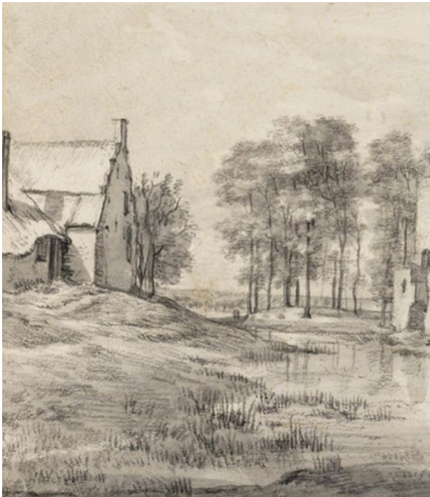
Tekening van 'd Waell Rant op de tekening van Lievendaal door Roelant Roghman, 1646/1647, Collectie Teylers Museum, Haarlem

Ook werd in de beschrijving van 1662 door Steven van Lennip nog gesproken over het huis 'd'Waell Rant', wat ongetwijfeld het huis was wat ook op de onderstaande tekening van Roelant Roghman staat.