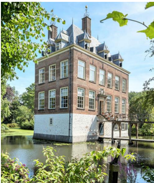
Kasteel Oudegein (2019) xxiv