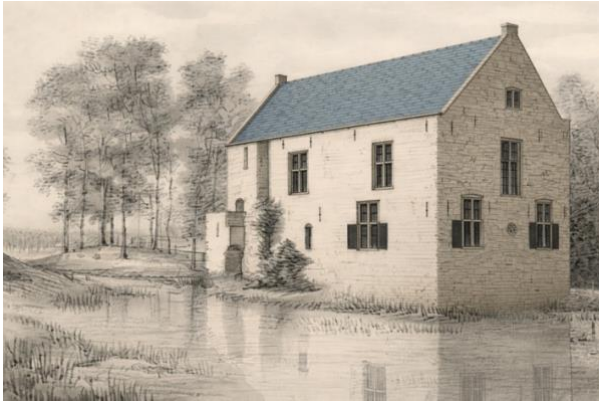
Visualisatie van de herbouw van Lievendaal in 1662. Ontbrekend zijn nog de stal en de ophaalbrug

Ook werd in de beschrijving van 1662 door Steven van Lennip nog gesproken over het huis 'd'Waell Rant', wat ongetwijfeld het huis was wat ook op de onderstaande tekening van Roelant Roghman staat.