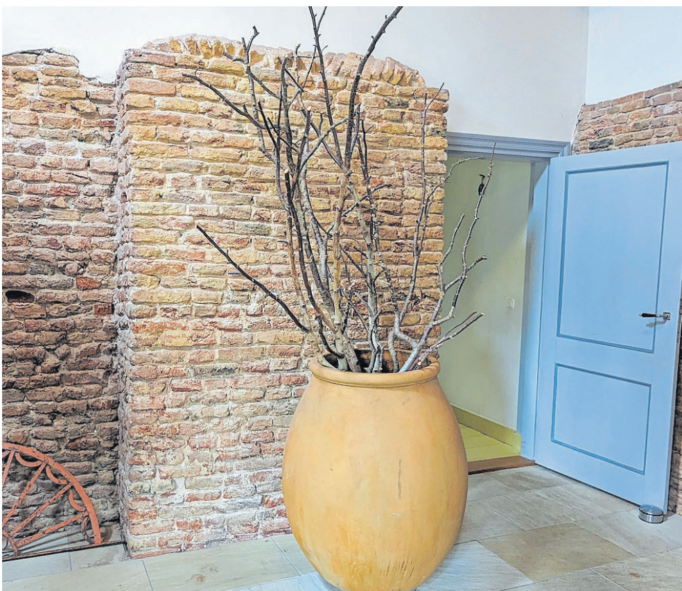
■ De oude stenen in de muur van de hal.