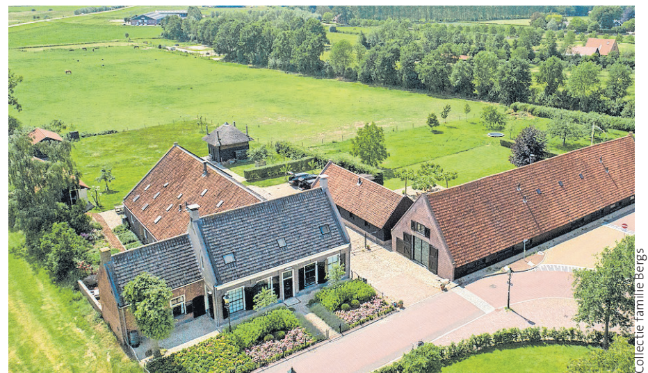
■ Luchtfoto Rodestein en detabaksschuur.