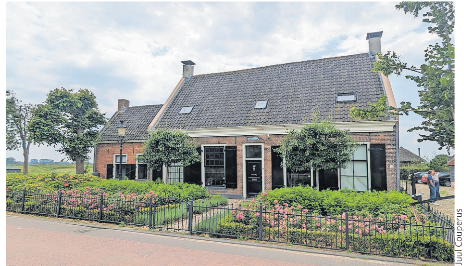
■ Rodestein, in juni 2024.